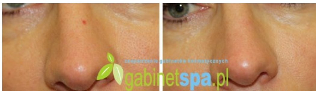
Zamknięcie naczynka (spot) - 1 zabieg, przed zabiegiem i 30 dni po zabiegu.