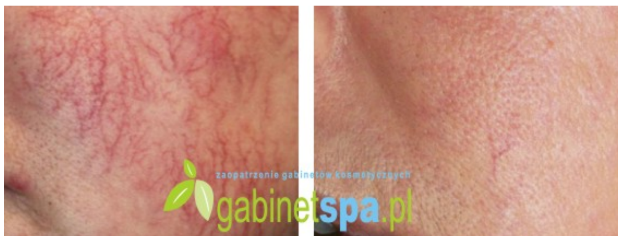
Zamykanie pajęczków na twarzy - 1 zabieg, przed zabiegiem i 30 dni po zabiegu.