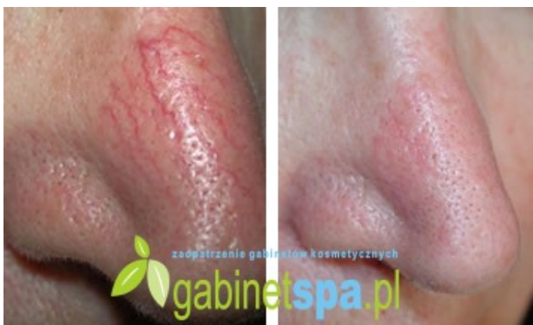
Zamykanie pajęczków na nosie - 1 zabieg, przed i 3 godz. po zabiegu.