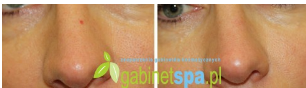
Zamknięcie naczynka (spot) - 1 zabieg, przed zabiegiem i 30 dni po zabiegu.