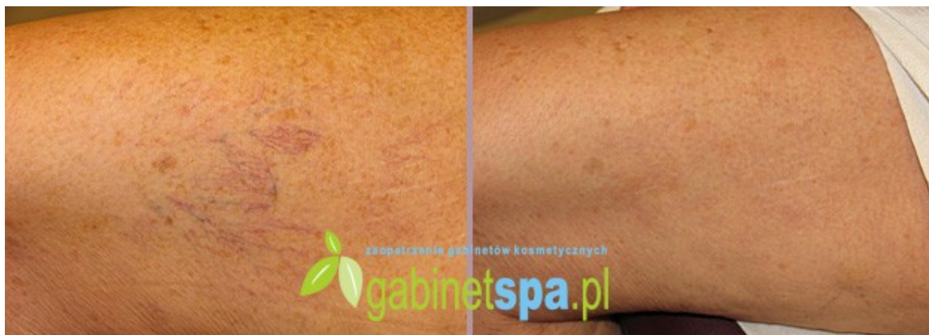
Zamykanie pajęczków na udzie - 1 zabieg, przed zabiegiem i 14 dni po zabiegu.