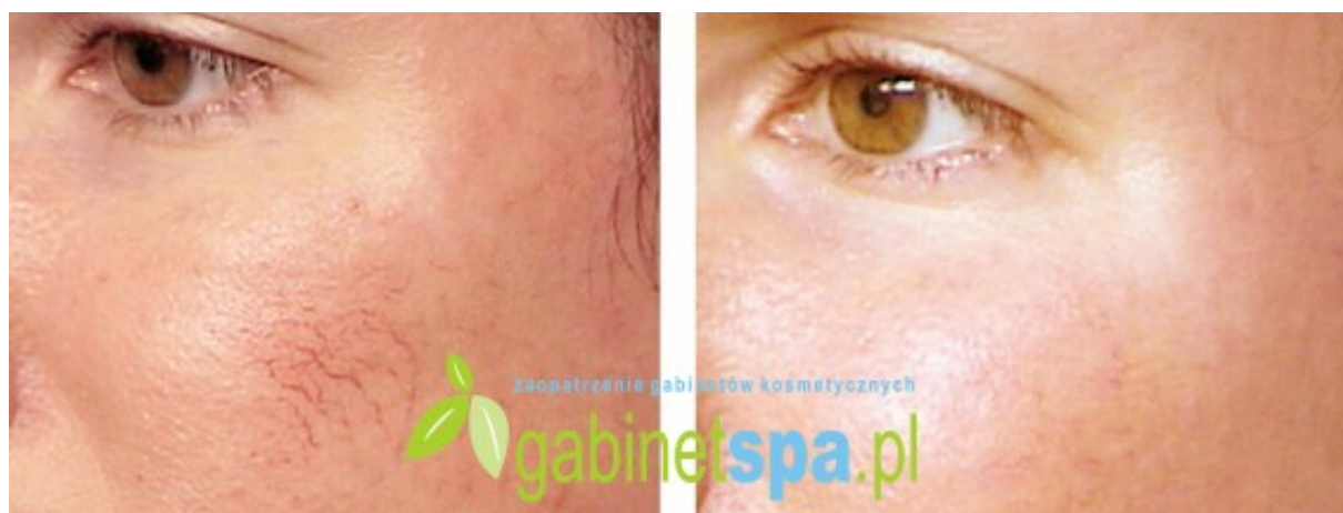
Zamykanie pajęczków na twarzy - 1 zabieg, przed zabiegiem i 30 dni po zabiegu.